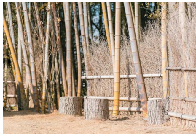
切り株で作られた、憩いの椅子