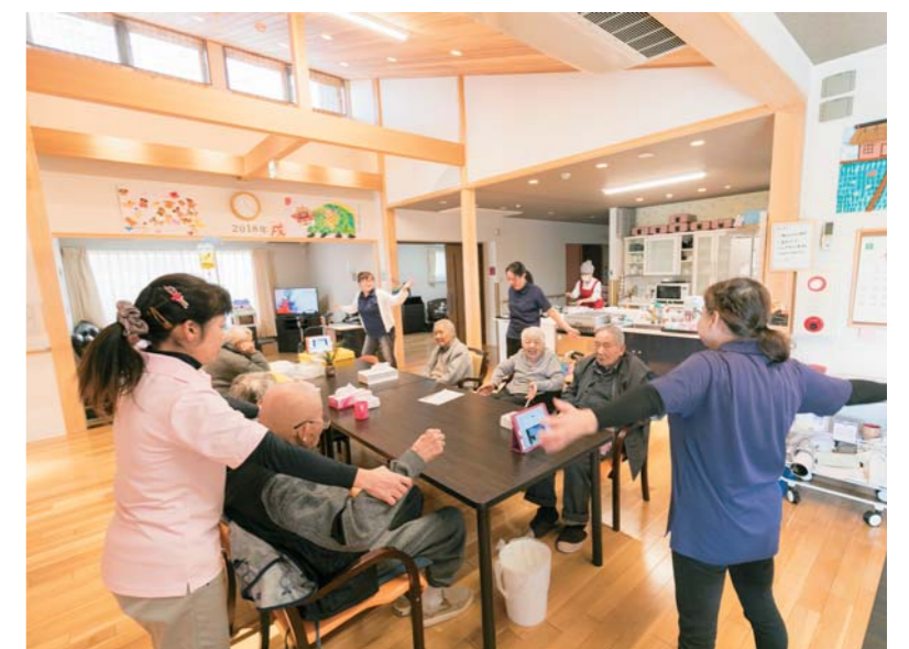
スタッフと、ゆつくり！一緒に！楽しく！

こみなみの家 ☎0794-62-1111 (本部直通) 小野市天神町字後山1183-79 駐車場●あり www.kominami.co.jp