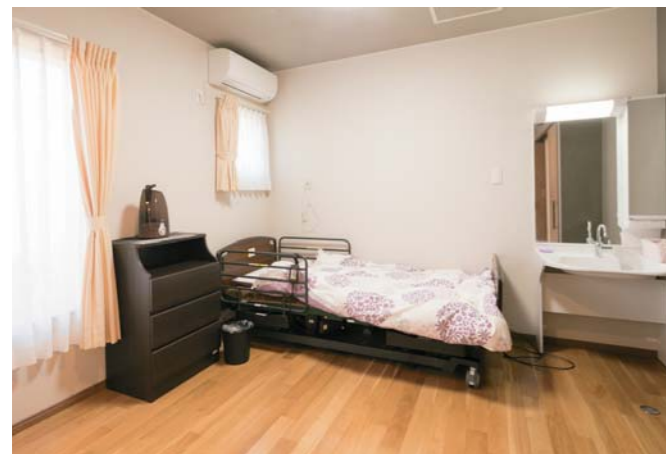
最期まで家族が寄り添える広い室内